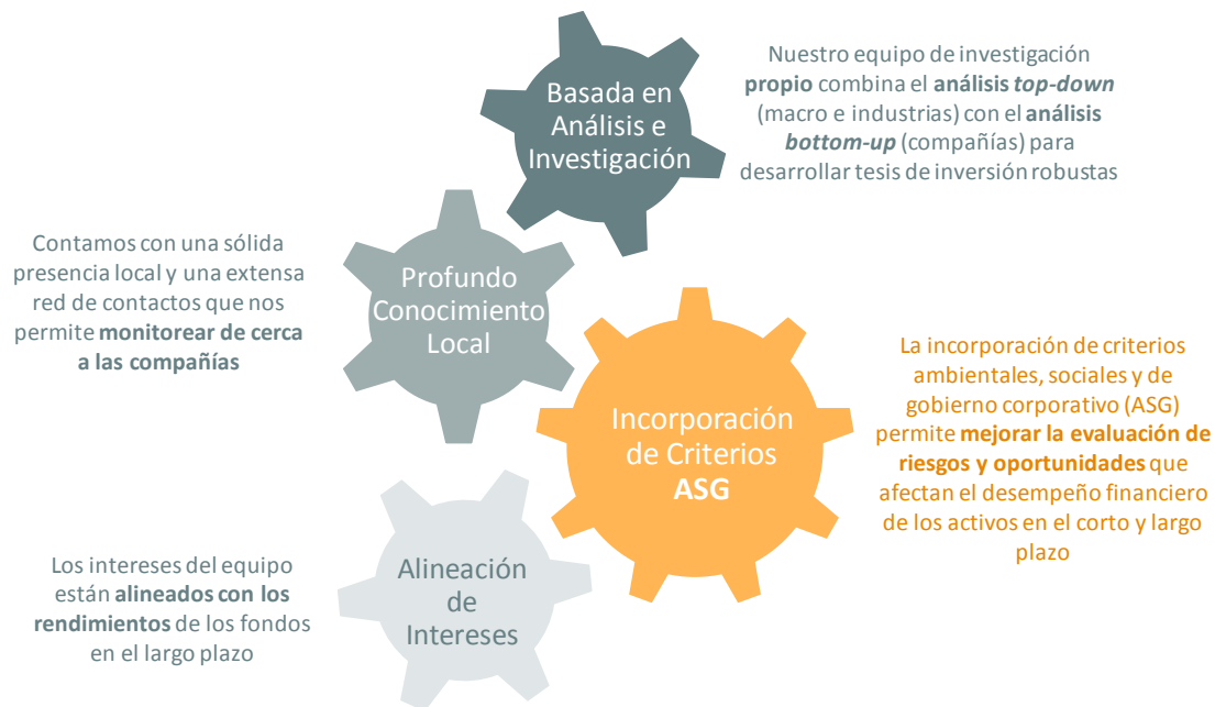
Figura 3. Filosofía de Inversión de Credicorp Capital Asset Management