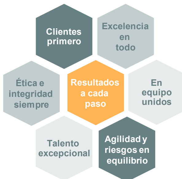
Figura 1. Principios Corporativos de Credicorp Capital

Como inversionista responsable, Credicorp Capital Asset Management reconoce la importancia de la propiedad activa como componente central de su deber fiduciario. Creemos que, al involucrarnos con las compañías en las que invertimos, tenemos la