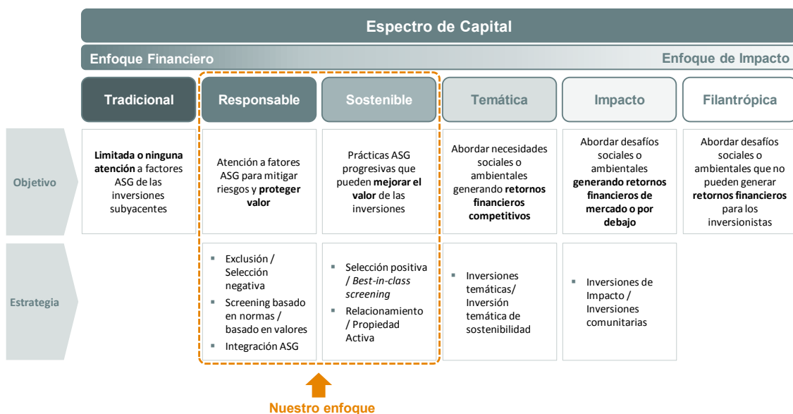
Figura 2. Estrategias de Inversiones Sostenibles y Responsables